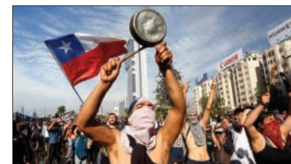
PROTESTAS EN CHILE.

2019: en Chile se desatan protestas, origi-